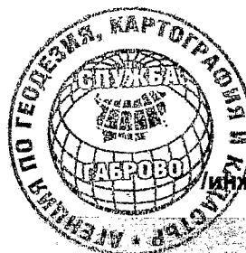
Схема № 15-433434-28.05.2020 г. издадена въз основа на заявление с входящ № 01-207693-26.05.2020 г.

Акт за частна общинска собственост № 339 от 14.07.1997г., издаден от ОБЩИНА ГАБРОВО