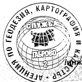
Схема № 15-406774-09.05.2019 г. издадена въз основа на документ с входящ № 01-200059-08.05.2019 г.