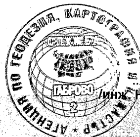
Схема № 15-406651-09.05.2019 г. издадена въз основа на документ с входящ № 01-200059-08.05.2019 г.