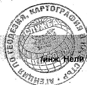
Схема № 15-105684-07.02.2019 г. издадена въз основа на документ с входящ № 01-50279-06.02.2019 г.