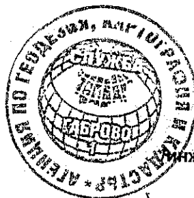
Схема № 15-409435-24.08.2017 г. издадена въз основа на документ с входящ № 01-248570-14.08.2017 г.