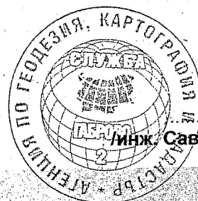
Схема № 15-1100982-24.11.2020 г. издадена въз основа на заявление с входящ № 01-549646-24.11.2020 г.

Носители на други вещни права по данни от КРНИ: няма данни