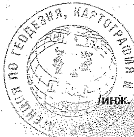
Схема № 15-736430-13.08.2020 г. издадена въз основа на заявление с входящ № 01-361677-13.08.2020 г.

Акт за частна общинска собственост № 80 том 5 рег. 1470 от 15.07.2020г., издаден от Служба по вписванията гр.Габрово