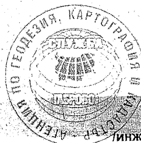
Схема № 15-165219-16.02.2022 г. издадена въз основа на заявление с входящ № 01-77396-11.02.2022 г.