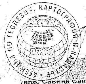
Схема № 15-295701-21.03.2022 г. издадена въз основа на заявление с входящ № 01-144809-16.03.2022 г.