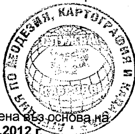
Схема № 2194 / 18.04.2012 г. е издадена въз основа на документ с входящ № 99-1813 / 11.04.2012 г.