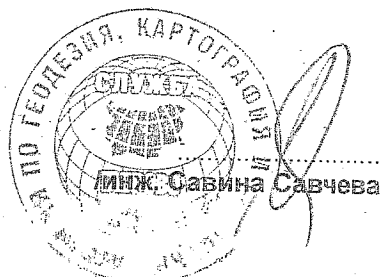
Схема № 15-1057763-11.11.2020 г. издадена въз основа на заявление с входящ № 01-493156-22.10.2020 г.

Акт за частна общинска собственост № 829 от 10.04.2001г., издаден от ОБЩИНА ГАБРОВО