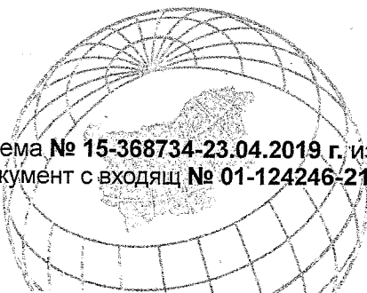
Схема № 15-368734-23.04.2019 г. издадена въз основа на документ с входящ № 01-124246-21.03.2019 г.