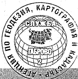
Схема № 15-790342-28.08.2020 г. издадена въз основа на заявление с входящ № 01-388568-27.08.2020 г.

Акт за частна общинска собственост № 92 том 6 рег. 1800 дело 703 от 17.08.2020г., издаден от АВ - СЛУЖБА ПО ВПИСВАНИЯТА - ГР. ГАБРОВО