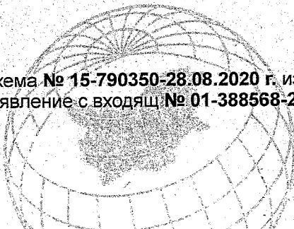
Схема № 15-790350-28.08.2020 г. издадена въз основа на заявление с входящ № 01-388568-27.08.2020 г.

Акт за частна общинска собственост № 149 том 6 рег. 1896 дело 759 от 24.08.2010г., издаден от АВ - СЛУЖБА ПО ВПИСВАНИЯТА - ГР. ГАБРОВО