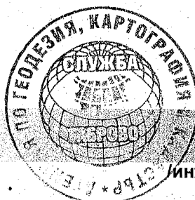
Схема № 3058 / 19.05.2012 г. е издадена въз основа на документ с входящ № 99-2552 / 18.05.2012 г.