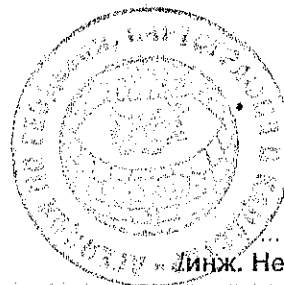
Схема № 15-561734-16.11.2016 г. издадена въз основа на документ с входящ № 01-354163-15.11.2016 г.

Акт за частна общинска собственост № 634 от 04.02.1999г., издаден от ОБЩИНА ГАБРОВО