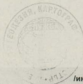
Схема № 5530 / 30.08.2012 г. е издадена въз основа на документ с входящ № 99-4651 / 29.08.2012 г.